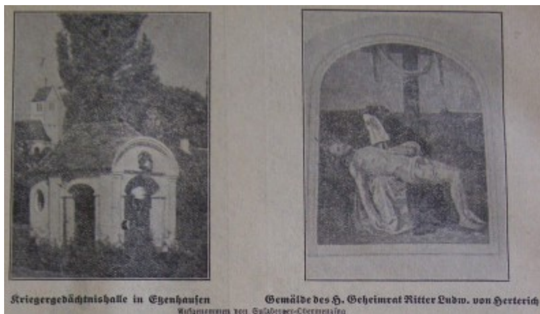
Kriegergedächtnishalle in Etzenhausen